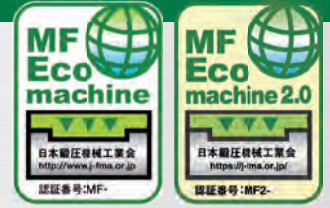
「MFエコマシン」 認証マーク

一般社団法人日本鍛圧機械工業会は2009年4月より、環境配慮型製品の開発促進と環境負荷の低減を目的として「MFエコマシン認証制度」を運営して参りました。この度2021年10月に政府が閣議決定した「地球温暖化対策計画」と整合をとった新たな認証基準「MFエコマシン 2.0」を2024年6月より追加し、この認証製品を拡販することでその製品を使用されるお客様の省エネに貢献することを目的としました。これにより「MFエコマシン認証制度」には下記の2つの認証基準を有することになり、この制度は日鍛工 会員企業製品に適用し、外部有識者が参加した認証審議会において、適合審査・認証・登録・公表を行う制度となります。