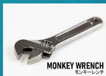
ミニチュア工具 (キャストム)