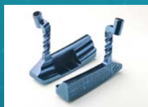
ゴルフのパターヘッド (伊福精密)