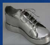
板金の靴 (晃新製作所)