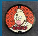
キン肉マン・ちびまる子ちゃん のマンホール(日之出水道機器)