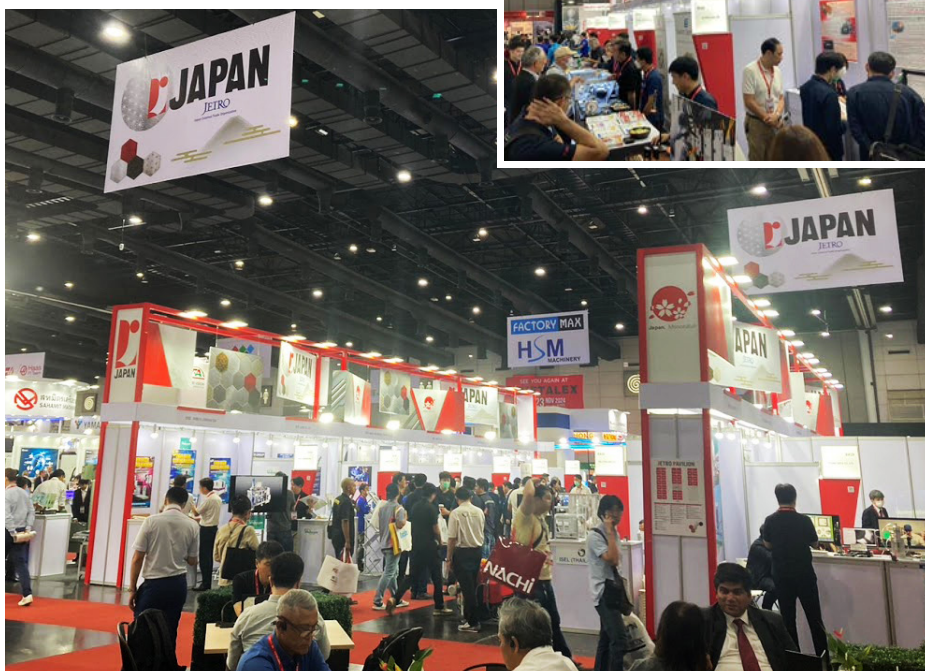
昨年度のジェトロ・パビリオンの様子