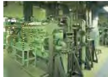
1,000KWクラス ガスエンジン発電設備